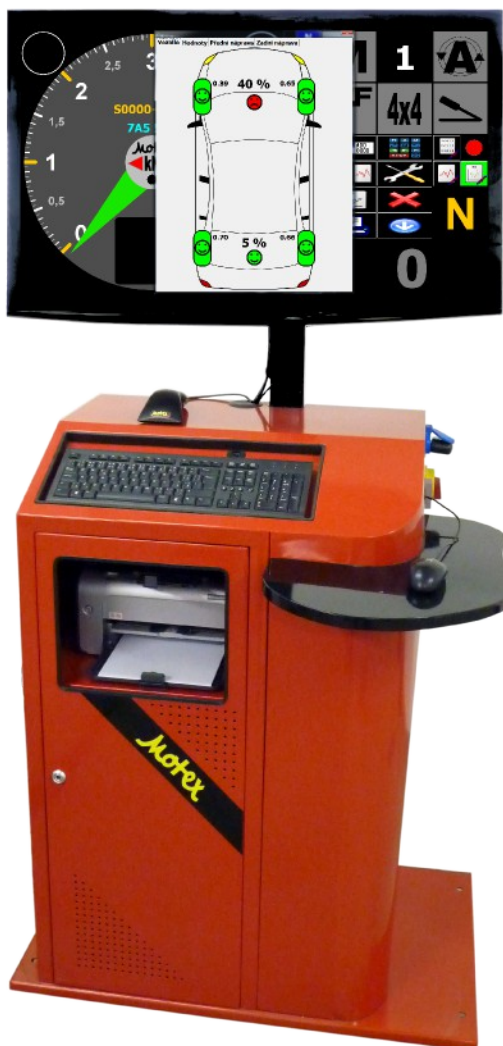
Vestavěná verze (do jámy)